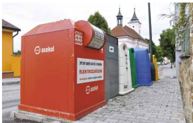
Kontejnery na elektrozařízení před ZŠ ve Švehlově ulici.